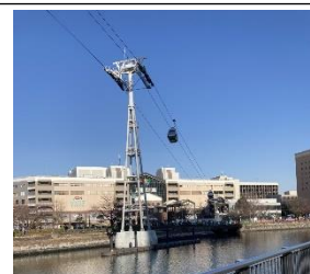
YOKOHAMA AIR CABINの様子