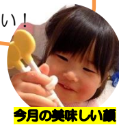
今月の美味しい顔