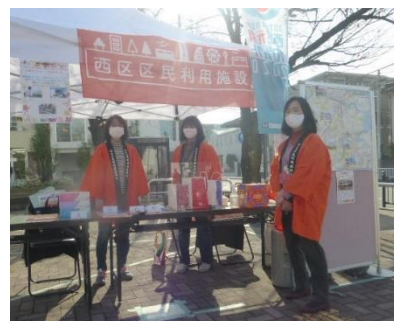
西区 eco チャレンジ 2020 取り組みメニューと景品

そして、「西区元気プロジェクト2020」は区民祭りなどの地域活動が中止・縮小を余儀なくされる中で活動の中心になってきました。西区役所正面入り口前での日替わりブース出展(写真右は出展例)や、地域団体によるパフォーマンス動画公開などを実施しながら、地域のたくさんの連携イベント(2ページ参照)をとりまとめてきましたが、12月6日の終了日を迎えました。