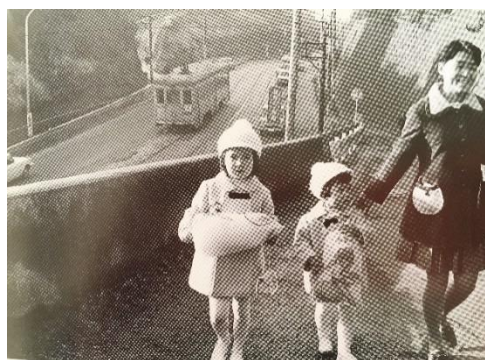
昭和46年頃の野毛坂

何処で買ったのでしょうか、昔も今も人気の綿菓子を持っている姉妹と思われるふたり、小さな子の背中を押している親の姿が微笑ましく感じられます。こうした風景はこれからも大切にしたいですね。