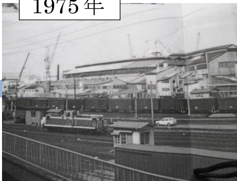
▲昭和50年頃の旧三菱重工横浜造船所