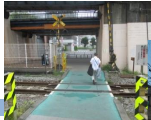
▲戸部とみなとみらい地区を結ぶ、「三菱ドック踏切」