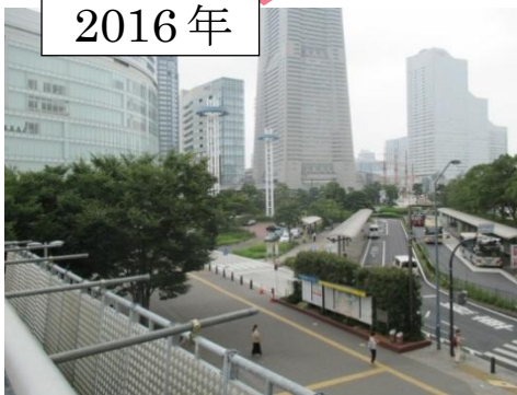
▲現在の桜木町駅からみなとみらい方面