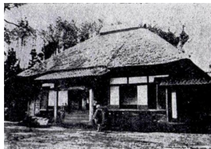
明治42年頃の願成寺

願成寺は、戦国時代末、約460年前に建立されたと言われ、明治時代に今の場所に移されるまでは、くらやみ坂の下にありました。