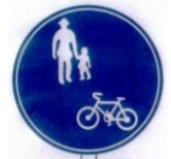
「自転車通行可」の標識