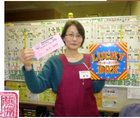
藤棚地区センター