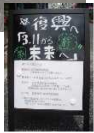
東日本大震災支援に行く（右下）