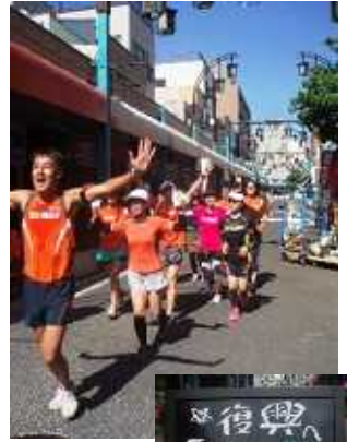
全員、無事完走！（右上）