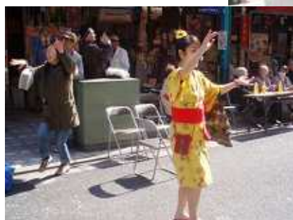
お客さんと出演者も 一緒に手拍子と踊り