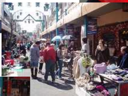
暖かい日差しを浴びながら 値引きの交渉も