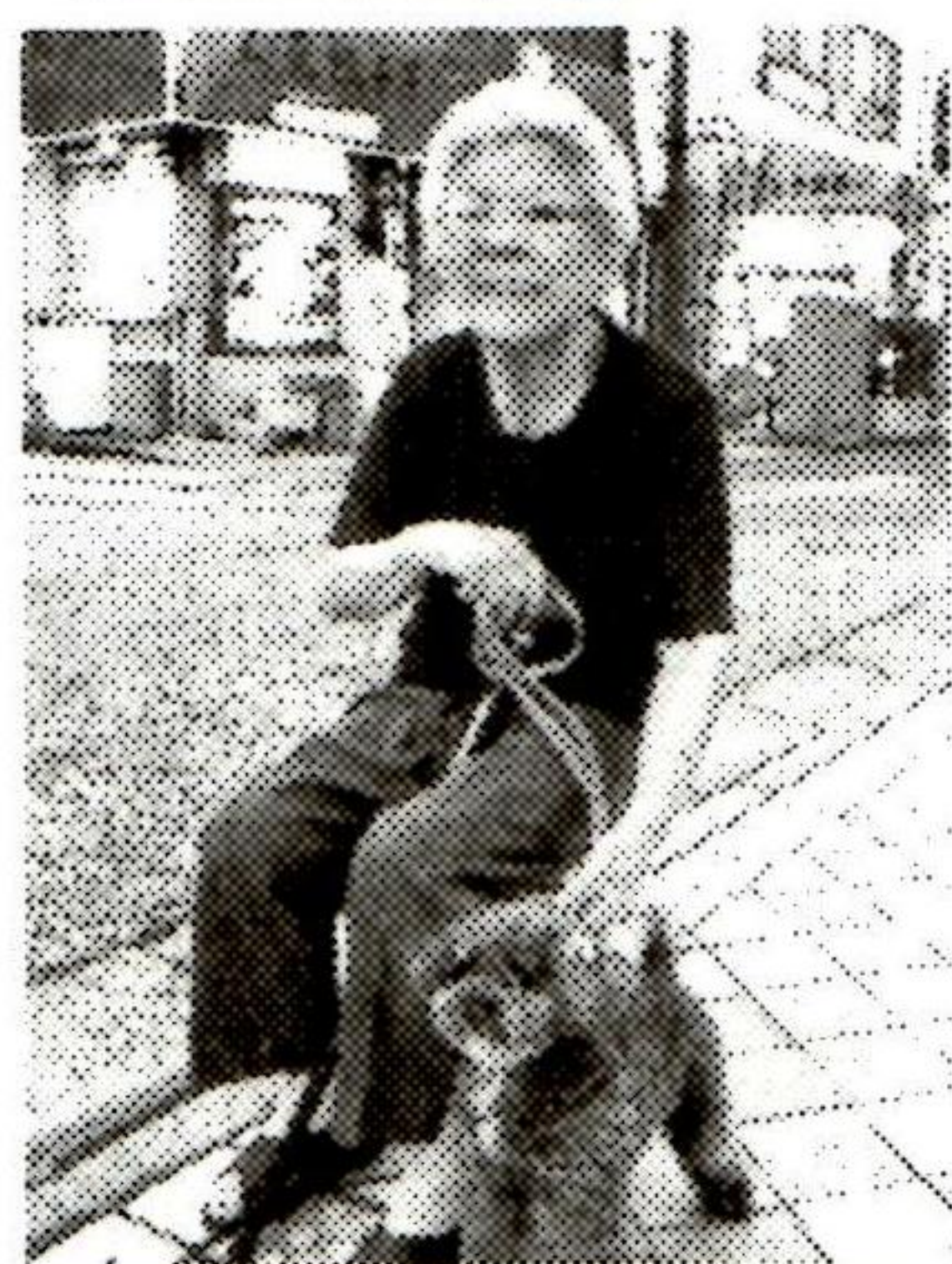
車止めで一休み、娘さんを待つ